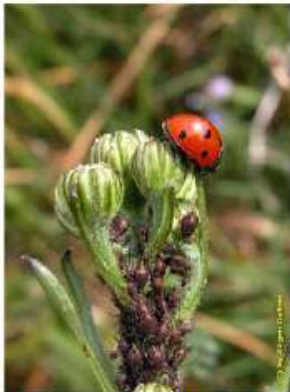
Marienkäfer frisst Blattläuse.

Marienkäfer sind kleine, oft rot oder gelb gefärbte Käfer mit schwarzen Punkten auf den Flügeldecken.